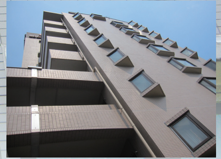
施工後の様子。外観の変化はありません。(※1)