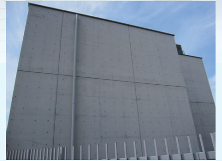
海沿いのコンクリート打ち放し建築物。Sクリートガード施工後10年経過しているが、クラック・爆裂・黒カビの発生が無く、良い状態を継続しています