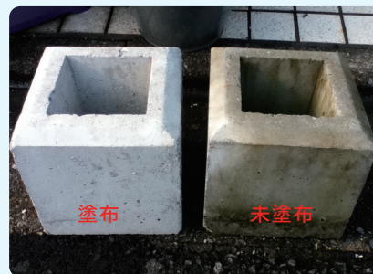
6ヶ月経過後の写真（右塗布・左未塗布）

黒カビや雨垂れで黒ずんでしまったコンクリート面やタイル面も、Sクリートガード®が強固に守り、建物の美しさと強さを保ちます。