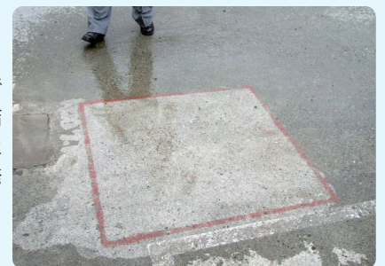
北海道屋上駐車場コンクリート床 6年経過後の写真（赤枠内のみ試験施工）

Sクリートガード®は氷点下20℃までの温度環境でも施工可能です。凍結融解や融雪剤など、コンクリートにとって厳しい環境でも優れた効果を発揮します。