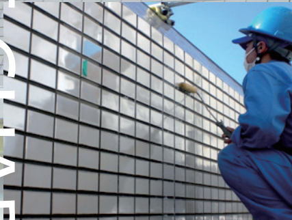
Sクリートガードはラスタータイルにも塗布できます

(注意事項：酸性洗剤を用いて洗浄後に塗布した場合には変色するおそれがあります。 必ず専用のアルカリ洗剤にて中和処理後に塗布してください)