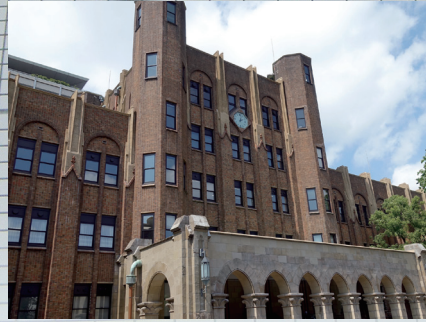
Sクリートガードはタイル面を保護します