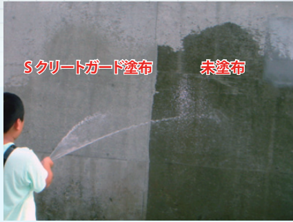
試験施工から10年経過後の追加試験の様子 10年経過後も撥水性能を保持しています