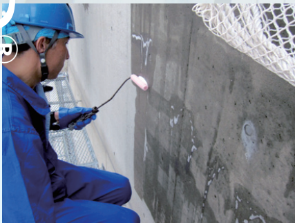
築14年のコンクリート打ち放し建築物への塗布。Sクリートガードの高い浸透性能がよく分かります